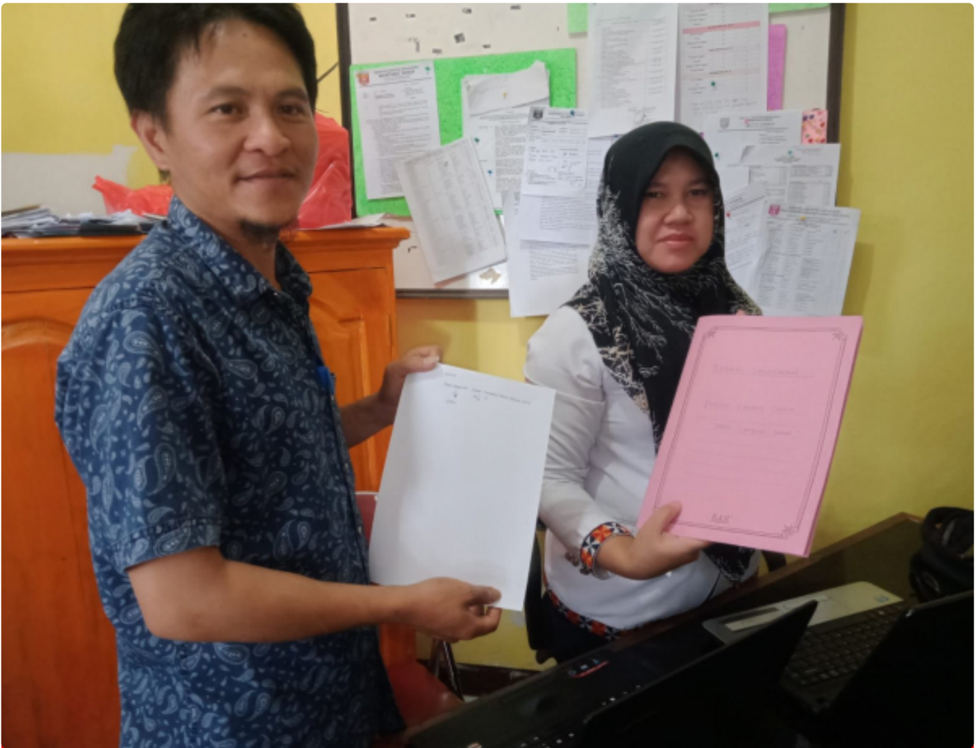
Aparatur pekon padang cahya

Lampung Barat, Pemberhentian aparatur pekon secara sepihak dan tak